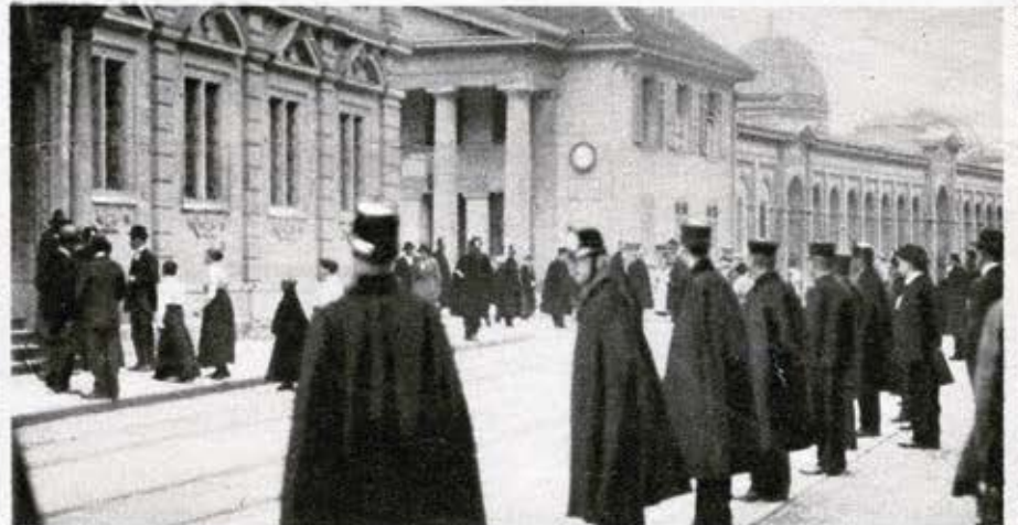
Die Straße vor dem Zürcher Rathaus ist durch Polizeitruppen abgesperrt.