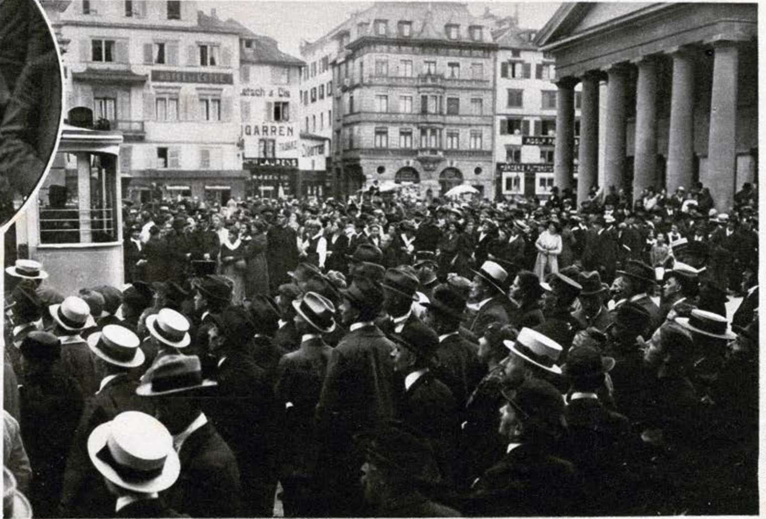
Die gewaltige Menschenmenge vor dem Zürcher Rathaus in Erwartung der Ereignisse.

Vorletzten Montag empfing der Zürcher Kantonsrat eine Abordnung der Zürcher Arbeiterfrauen, um ihre Klagen über die Lebensmittelversorgung entgegenzunehmen. Es dürfte dies das erste mal sein, daß Zürcher Bürger Gebrauch von einem ihnen zustehenden Rechte machen, indem sie sich direkt an das Parlament wenden, um ihre Klagen vorzubringen.